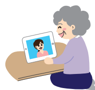
月2回の看護師による オンライン面談

医学的理論に基づいた認知症予防サービスが2021年1月より始まります。 看護師があなたと伴走し、楽しく脳と健康の維持・向上を支援します