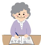
定期的に届く 脳トレドリル