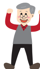
生涯健康習慣の獲得