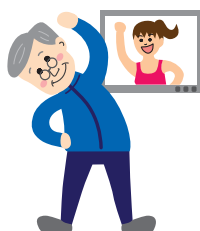
毎日動画を見ながら運動