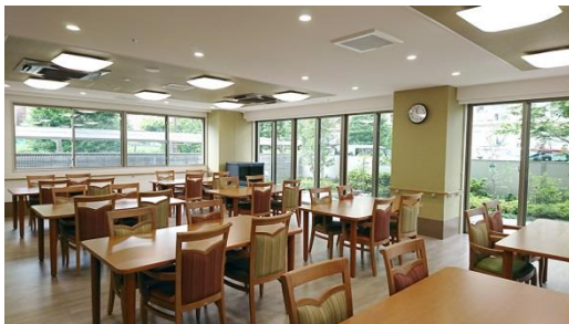
共用食堂(イメージ)

和食を中心に、管理栄養士監修の栄養バランスのとれた食事を 1 食からオーダーできます。