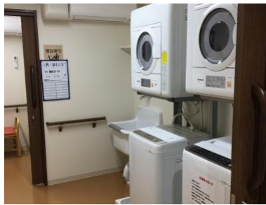
共用洗濯室(イメージ)

和食を中心に、管理栄養士監修の栄養バランスのとれた食事を 1 食からオーダーできます。