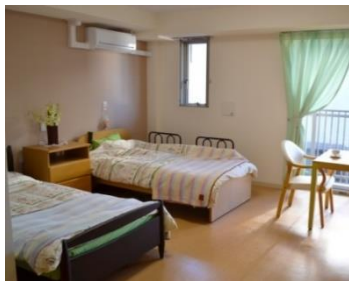
2 人用住戸(イメージ)