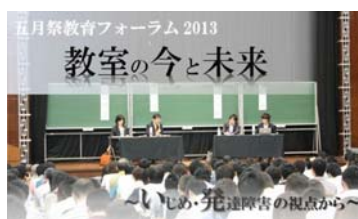
▲写真は昨年ものです